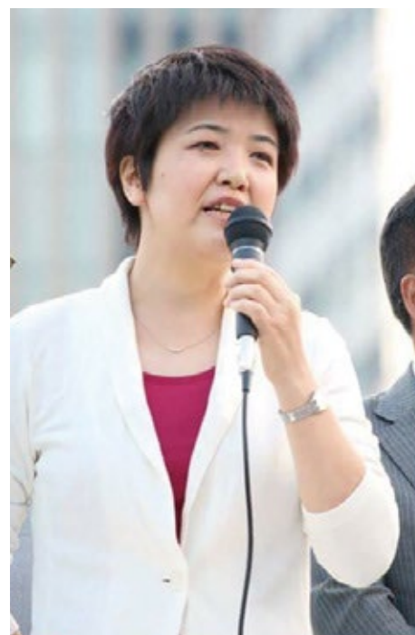
「街頭で政策を訴える尾辻かな子」